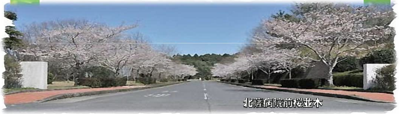
北薩病院前桜並木